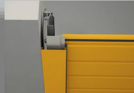
Montaggio in luce – con carter nel foro