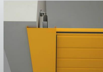
Montaggio in luce – con carter davanti al foro